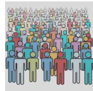
Уровень зарегистрированной безработицы (на конец года, %)

Банкротства или сокращения производств не предполагается.