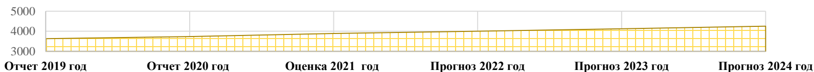
Объем отгруженных товаров собственного производства, выполненных работ и услуг (млн.рублей)

Оборот по полному кругу предприятий за 2020 год составил 4587,6 млн. рублей, что больше, чем в 2019 году на 3,1%. Оборот предприятий малого и среднего бизнеса вырос также на 3,1%.