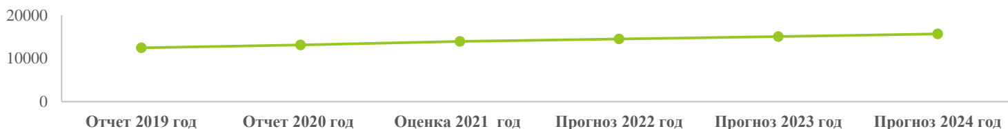
Величина прожиточного минимума (руб)

Уровень безработицы на 1 января 2021 года увеличился до 3,5% против 2,5% по состоянию на 01.01.2020г., имели официальный статус безработного 399 человек. К 2023 году уровень зарегистрированной безработицы будет держаться в пределах 3,0%, безработных станет меньше на 10-12 человек. Увеличение связано с требованием предоставления справки о занятости (или безработного) при постановке на учет в отделе социальной защиты населения малообеспеченных граждан.